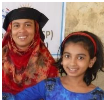
COVID-19 hulp ontvangen

Dit jaar deden we iets extra's, omdat ook Bangladesh en de mensen daar veel van de COVID-19 te lijden hebben. We begonnen deze aktie in eerste instantie voor de 30 door ons gesponsorde Sun Children. Toen kwam Wilde Ganzen echter met een 100% verdubbelingsaktie en konden we nog eens 30 gezinnen steunen. Daarbovenop kregen we nog eens een donatie van Stichting Jong. Uiteindelijk ontvingen 111 families 4 maanden Covid hulp en vervolgens een eenmalige bijdrage om hun inkomen te vergroten. Naast de gebruikelijke keuzes waren er ook families, die betal bladeren of groenten gingen kweken. Een paar zijn een thee-winkeltje begonnen en een rickshaw eigenaar kon eindelijk goede reparatie spullen en een elektrisch aandrijfmotortje aanschaffen.