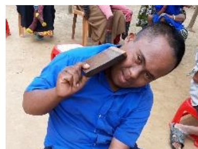
Met zelfgemaakte telefoon

COVID 19 AKTIE samen met St. WILDE GANZEN en anderen.