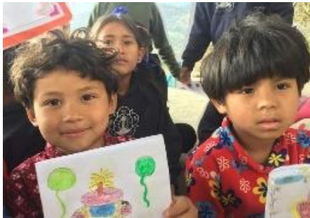
Sathya Uddhyan kids

Covid zorgde er hier voor dat deze kleine stichting weer aktiever was met hun hygiene programma op basisscholen. Aktueler kon het niet dit jaar. Ook hier ontvingen 10 vrijwilligers een T-shirt met P3M logo.