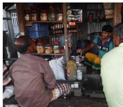
Thee winkeltje geopend