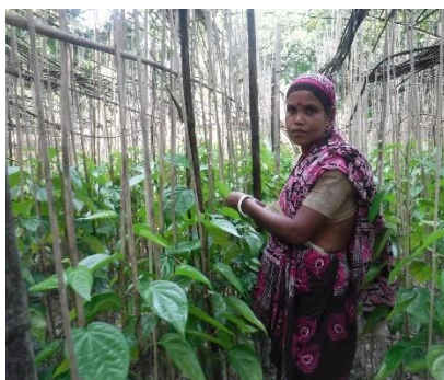
Betal blad kwekerij