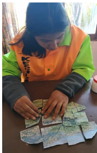
Nu in La Aldea