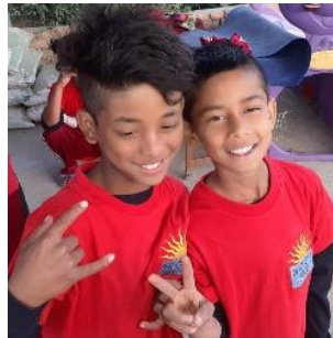
T-shirt met logo