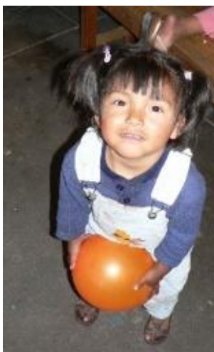
Nog in de gevangenis