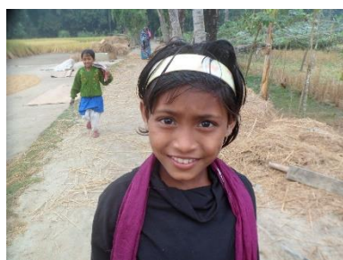
Sun Child op weg naar school

en van het Bisschop Bekkers Fonds een bedrag voor hulpmaterialen voor de kinderen.