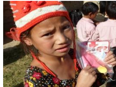
Hygiene les van DN